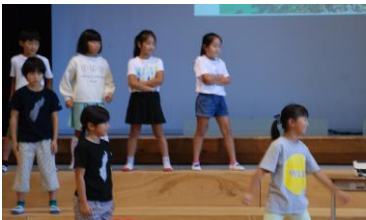
・3年生が、新島を守ろうとしている姿が、カッコよかった！