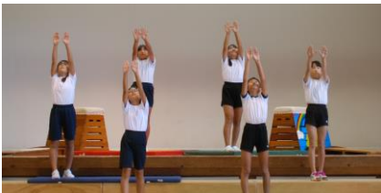
・一つ一つの技にキレがあり、最後のポーズもピシッと決まっていたのでカッコいい！