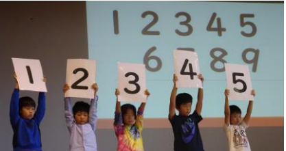
・英語で歌を歌えたのがすごい！ ・英語の発音も、上手でした！